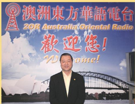
台长在东方电台的留影