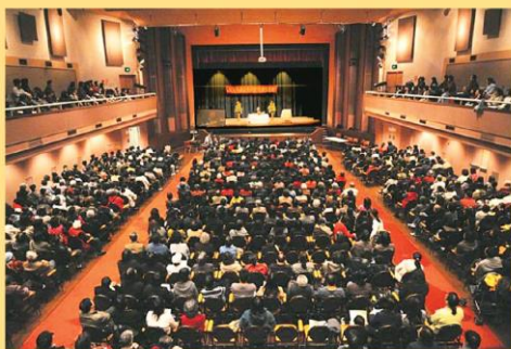
卢军宏台长《玄艺综述大型解答会》